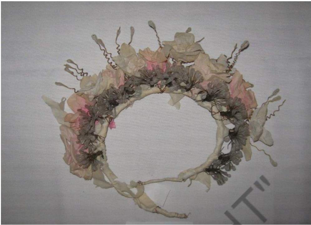
05 Свадебный восковой веночек из фондов Кумылженского историко-краеведческого музея ст. Кумылженская Кумылженского р-на Волгоградской обл.

Волгоградская область, Кумылженский район, ст. Кумылженская Кумылженский историко-краеведческий музей