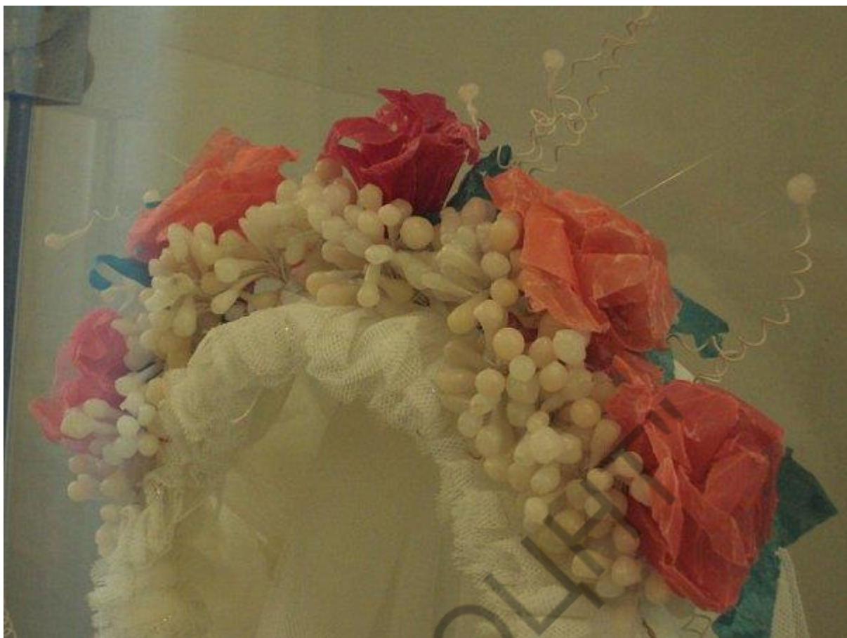
04 Свадебный восковой венок из фондов Кумылженского историко-краеведческого музея ст. Кумылженская Кумылженского р-на Волгоградской обл.

Волгоградская область, Кумылженский район, ст. Кумылженская Кумылженский историко-краеведческий музей