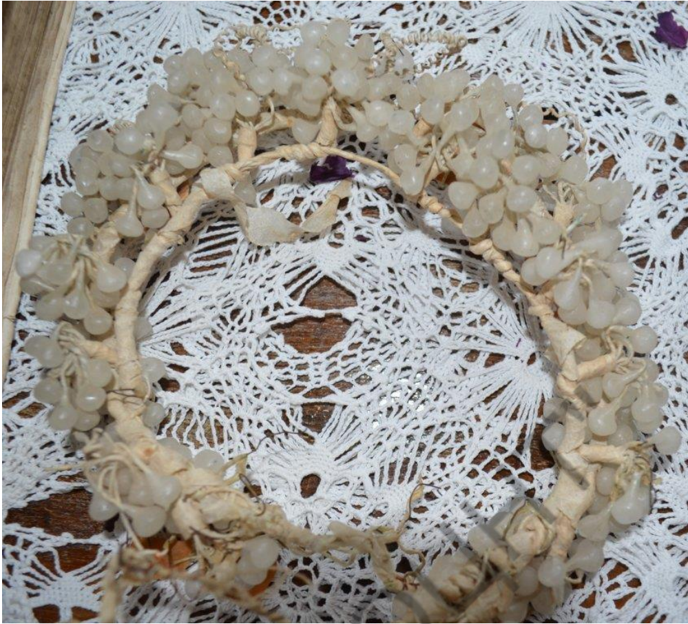
07 Свадебный восковой веночек из фондов Фроловского городского краеведческого музея г. Фролово Фроловского р-на Волгоградской обл.

Волгоградская область, Фроловский район, г. Фролово Фроловский городской краеведческий музей